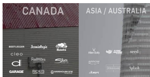
Hình 3.1: Một số khách hàng tiềm năng của Asmara Việt Nam

Trong quá trình thực hiện tự đánh giá, các đơn vị phòng ban và trung tâm tham gia cung cấp thông tin, số liệu và minh chứng thực hiện theo chức năng nhiệm vụ của các đơn vị.